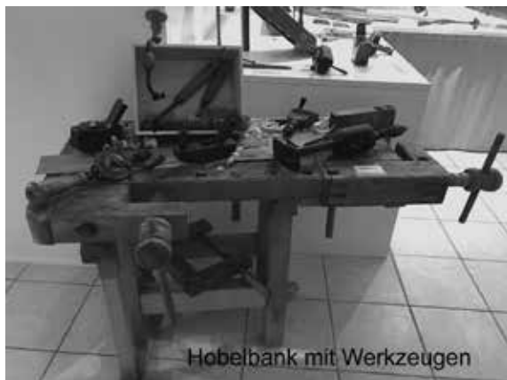
Hobelbank mit Werkzeugen

Die Besucher sind immer wieder erstaunt über die vielen Maschinen, Werkbänke und Werkzeuge, die in dieser Ausstellung zu sehen sind.