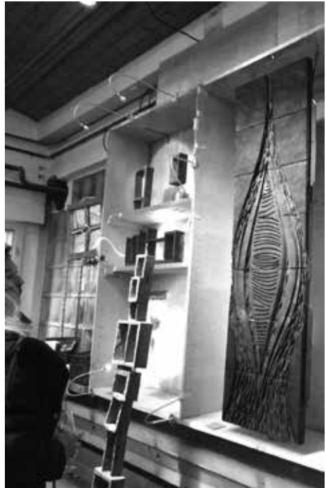
Vor Ort entstanden, nur mit Material von hier