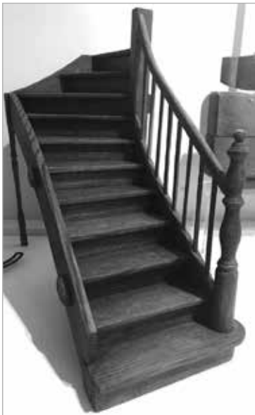
Modell einer Treppe zur Veranschaulichung. Heute wird so etwas mit einem Drei-D-Modell auf dem Computer gemacht.